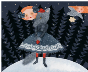
"Cappuccetto Rosso". Tecnica mista; 23,2 × 25,4 cm, Viive Noor